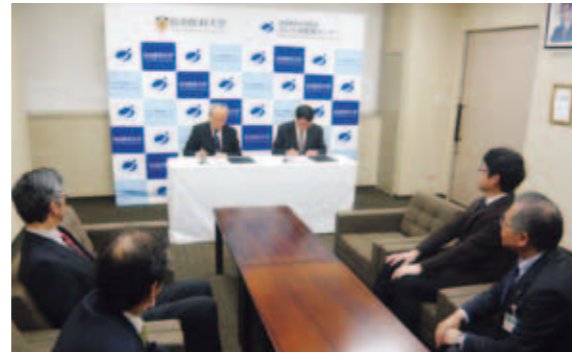
Saitama Northern Medical Center